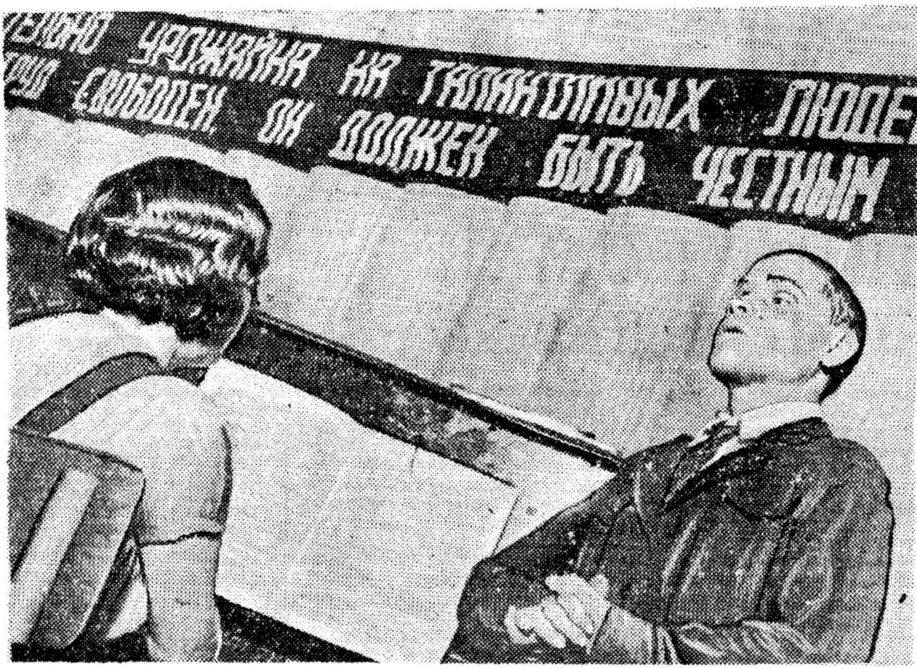
В Центральном парке культуры и отдыха им. Горького проводится олимпиада молодых дарований. Люди различных профессий и возрастов выступают на общемосковском смотре с показом своих достижений в области спорта, музыки, танца, акробатки.