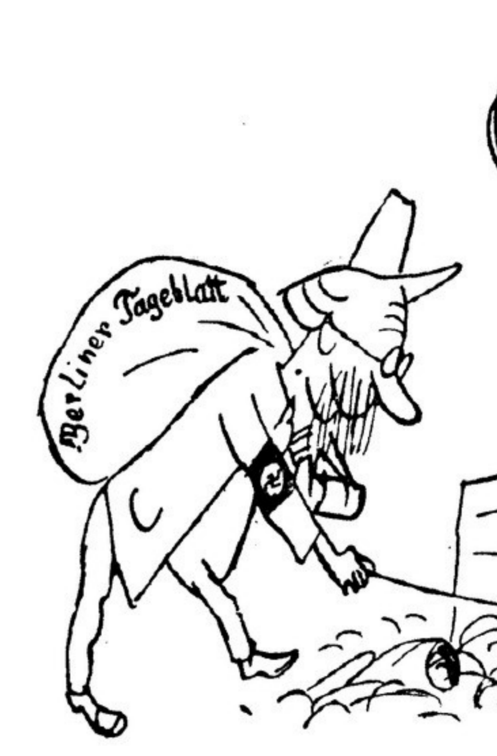
...ВСЕГДА ГОТОВЫ К УСЛУГАМ