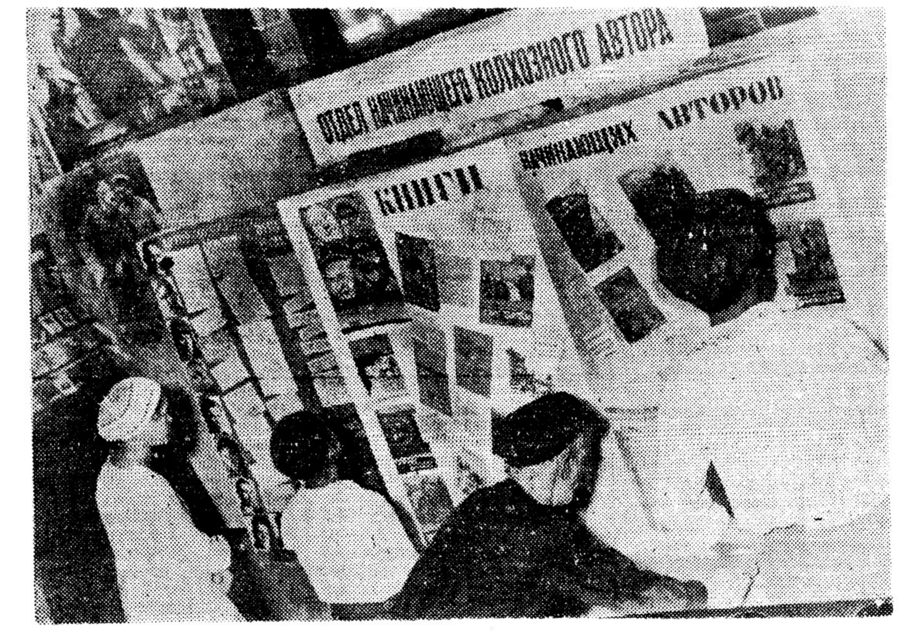
На выставке в Центральном парке культуры и отдыха «16 лет художественной литературы СССР». Отдел начинающего колхозного автора.

После 1905 года, в эпоху черносотенной контрреволюции, обширная группа либерально-буржуазных писателей, извернувшись в революционной борьбе и не находя в жизни никаких идеалов, за которые надлежало бы бороться, впадала в отчаяние.